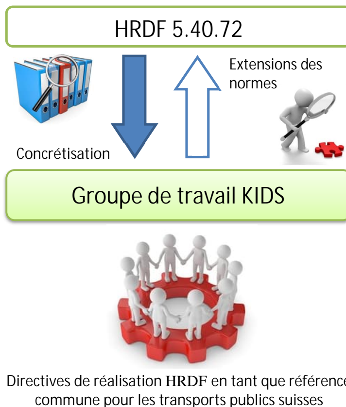
Figure 1 : Relations entre KIDS et HRDF

Il décrit les perspectives concrètes, ainsi que les divergences par rapport à la référence (norme HRDF [1]), l'objectif étant de garantir une application uniforme dans tous les transports publics suisses.